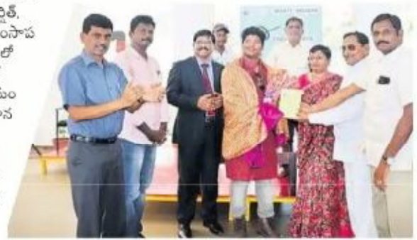
ఆర్చరీ క్రీడాకారుడిని సత్కరిస్తున్న పాఠశాల యాజమాన్యం