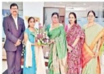
జిల్లా రెండో స్థానంలో నిలిచిన రెయిన్ బో స్కూలు విద్యార్థిని అభినందిస్తున్న కేరళాపాలిటెక్నిక్, ఉపాధ్యక్షులు